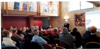
Petit dîner neovillais sur Voies sabbatiques samedi 7 février