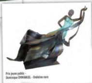
Prix jeune public - Dominique D'HMANUEL - Sédeline nare