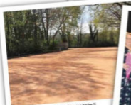
Un nouveau terrain où il fera bon de jouer aux boules !!