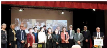
Visite du maire samedi 19 janvier