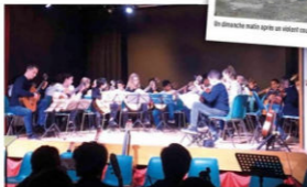
Audition guitare avec conservatoire à rayonnement régional