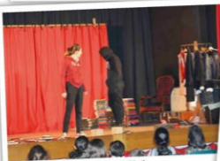
La compagnie Théâtre en stock au Festival des trésors - samedi 4 avril