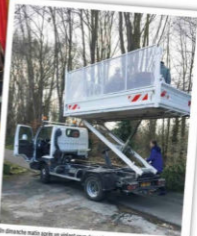
Un dimanche matin après un violent coup de vent