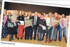
Présentation de Neoville 2019