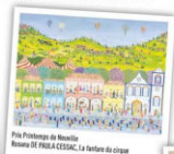
Prix Printemps de Neuville Assana DE PHILA CESSAC, La fantasia du cirque