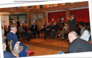
Grand débat national vendredi 15 février